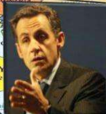
Николя Саркози, Президент Франции

«Мы не смогли показать пример общества, в которое они хотели бы влиться.»