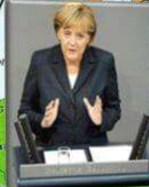
Ангела Меркель, канцлер Германии

«Очевидно, что мультикультурный подход, предполагающий счастливую жизнь бок о бок друг с другом, полностью провалился.»