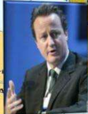
Дэвид Кэмерон, Премьер-министр Великобритании

«Очевидно, что мультикультурный подход, предполагающий счастливую жизнь бок о бок друг с другом, полностью провалился.»